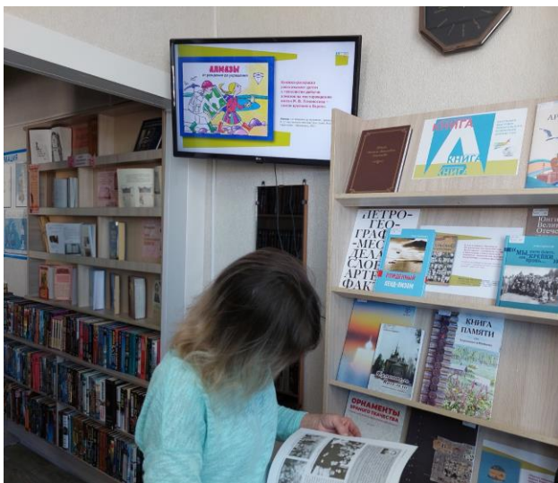
Межпоселенческая библиотека Плесецкого округа

Кроме того, к 31 марта участники акции получают видеопрезентацию, содержащую краткие сведения об изданиях из списка, которая может познакомить читателей с современным репертуаром издательской продукции нашего края. Видео может непрерывно транслироваться на экране или мониторе компьютера в зоне экспонирования выставки в беззвучном режиме.